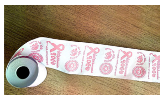
बस टिकट पर मुद्रित 1097 हेल्पलाइन नंबर

राष्ट्रीय टोल फ्री हेल्पलाइन: 1097 को बस टिकट के पीछे मुद्रित किया गया है। गुजरात राज्य सड़क परिवहन निगम जी.एस.आर.टी.सी के संभागीय क्लीनिकों में सुविधाएं एकीकृत परामर्श और परीक्षण केंद्र शुरू करने की योजना बना रहा है। गतिविधियों को पूरा करने के लिए सभी आवश्यक तकनीकी सहायता गुजरात एस.ए.सी.एस. द्वारा प्रदान की गई है।