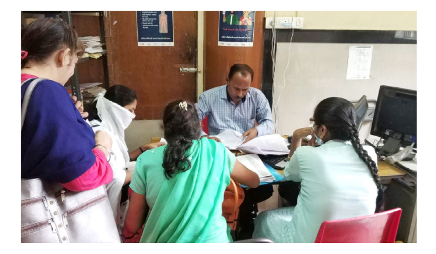
इस योजना को सितंबर, 2019 से कार्यात्मक बनाया गया है और पहले महीने में 127 विधवाओं को वित्तीय लाभ प्राप्त हुआ है। मासिक वित्तीय सहायता से यह अपेक्षा की जाती है कि लाभार्थी के जीवन स्तर को बढ़ाते हुए उपचार और पोषण की स्थिति में सुधार करें।